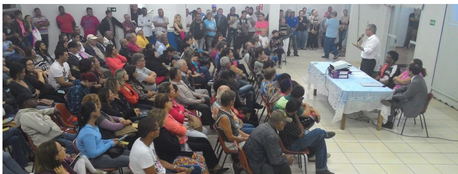
Assembleia votou contraproposta de reposição salarial e deu sequência às negociações do dissídio coletivo de 2015