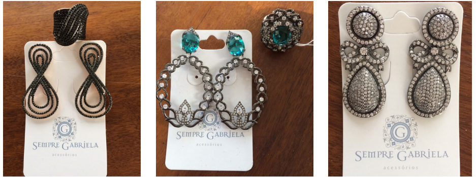
A Sempre Gabriela conta com acessórios para todos os públicos e ocasiões, com peças que custam a partir de R$ 20

Os interessados podem agendar uma sessão pelo telefone (19) 9.8194-8069. O consultório da psicóloga fica na rua Floriano Peixoto, nº 27, sala 3, Centro.