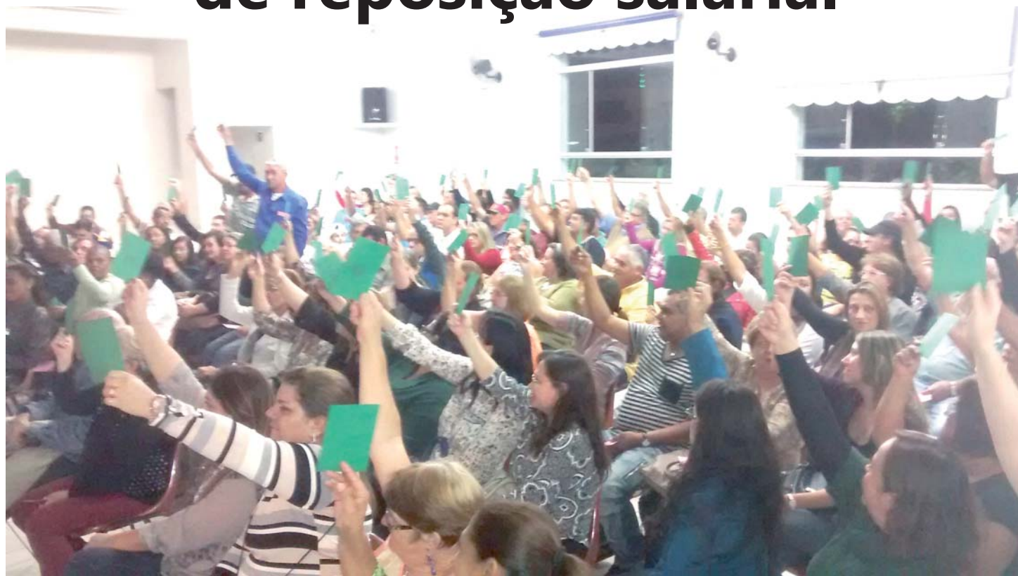
Servidores mostram o cartão verde e rejeitam proposta da Prefeitura - Pag. 4