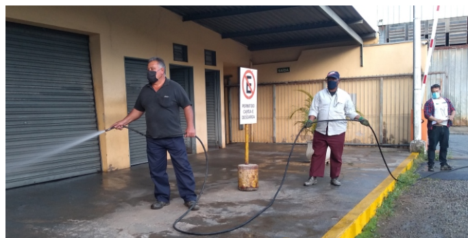
Higiene: funcionários limpam o Departamento de Saúde da Prefeitura