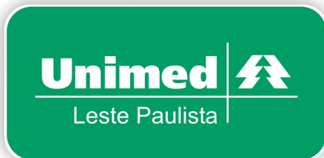
Reajuste: hospital comunica aumento mínimo atual aos associados