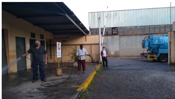
Saúde: servidores são os responsáveis pela limpeza das unidades