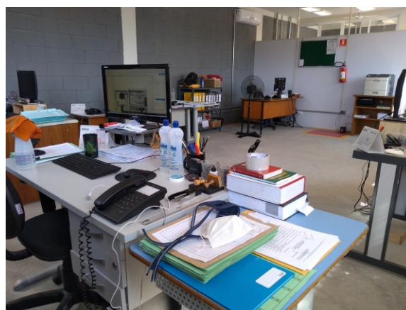
Escritório: espaço recém-construído começou a funcionar em 13 de julho