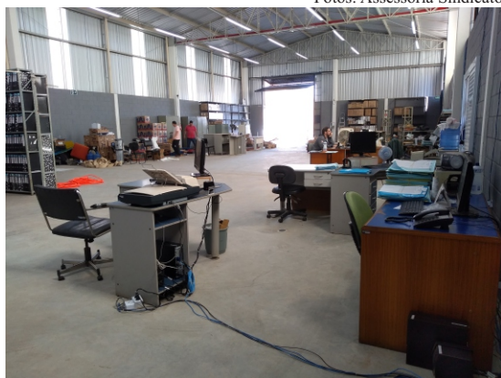
Novo Pátio: funcionários estão se adequando ao novo espaço