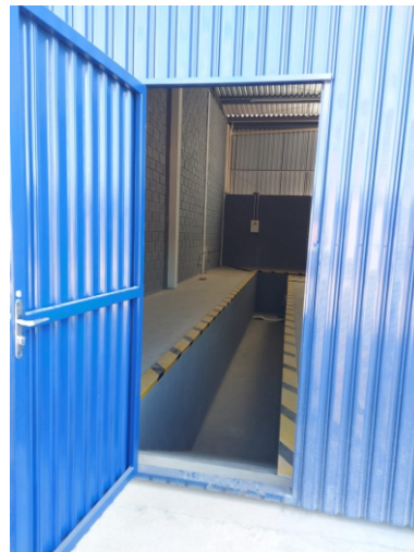
Espaço: Pátio fica em terreno de 182 mil 2