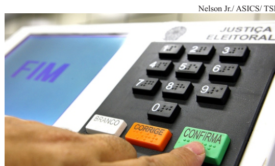
Modificação: para as eleições deste ano a biometria foi suspensa

A abordagem do candidato, a propaganda em rádio e TV e a transparência com os gastos em propaganda também continuam observando os mesmos parâmetros de controle.