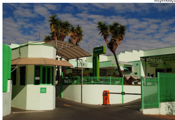
Unimed: até 15 de outubro quem entrar terá isenção de carência