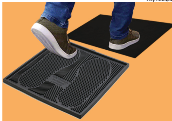
Tapete: promoção para o associado vai até o dia 15 de outubro