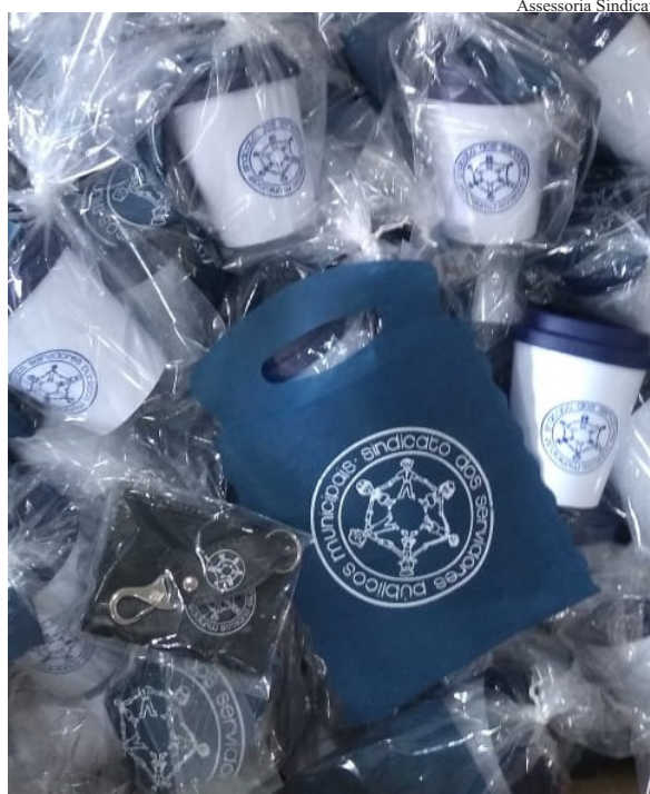
Brindes: Sindicato oferece kit em comemoração ao 'Dia do Servidor'