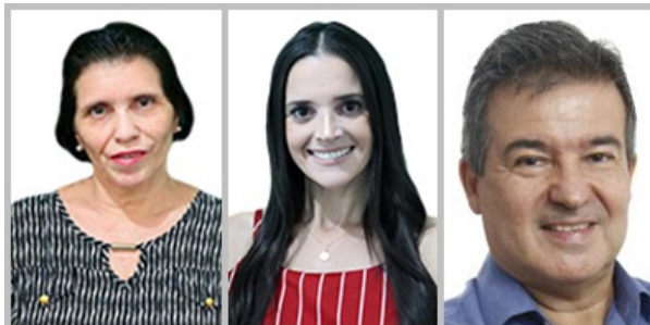
Cacilda PSD - 55888 Camila Scalon PDT - 12234 Claudinho MDB - 15222