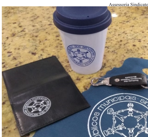
Kit: copo, carteira para cartão, chaveiro e lixo de carro