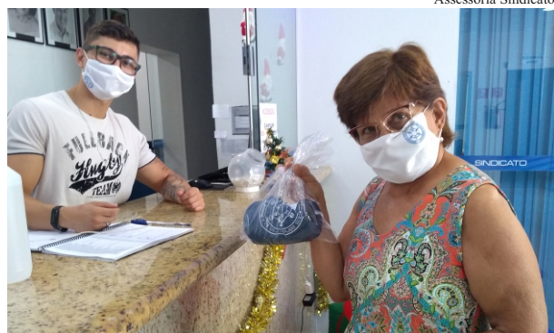
Assessoria Sindicato Kit: servidores associados podem retirar o brinde no Sindicato dos Servidores

Esta lembrança é para mostrar a importância dos servidores com a entidade; o kit pode ser retirado na sede do Sindicato até o dia 31 de dezembro.