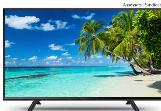
Assessoria Sindicato Sorteio: campanha de Smart TV visa expandir o nome do Sindicato

Confira os ganhadores no site ( sindicatosjbv.com.br ) ou no Facebook ( facebook.com/sindpublisjbv ). Na próxima edição do jornal O SERVIDOR iremos destacar os ganhadores.