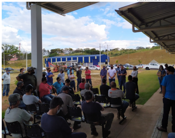
Bate-papo: funcionários atentos sobre a importância de respeitar os protocolos

a Covid-19. O resultado deu negativo em todos os funcionários presentes.