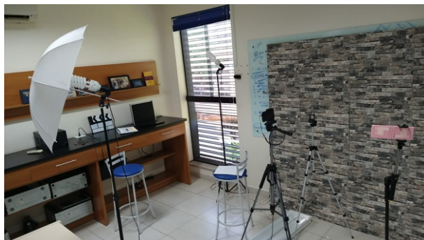
Estúdio: as aulas são gravadas e disponibilizadas no site do E-Ducar

A bolsa é totalmente gratuita para qualquer um dos 20 cursos disponíveis no site do E-Ducar. O associado pode fazer quantos cursos quiser, basta encerrar um, receber o certificado e ir para o próximo.