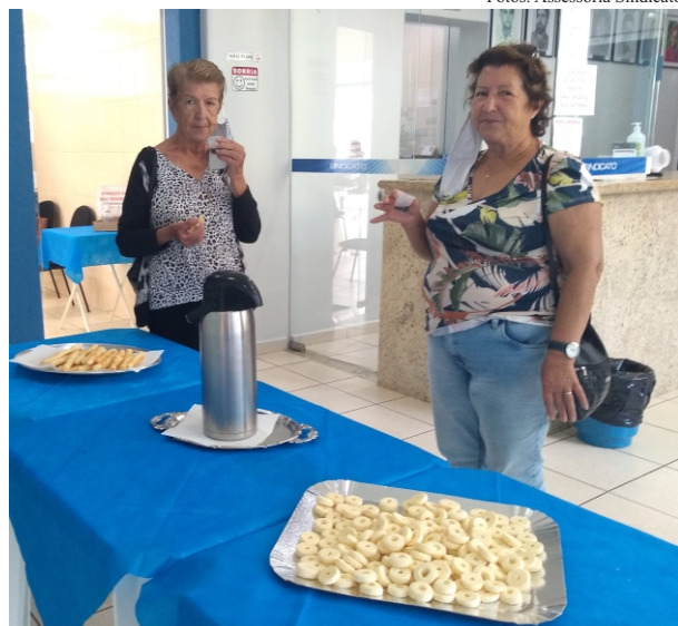
Especial: servidoras aproveitaram o café da manhã realizado no Sindicato