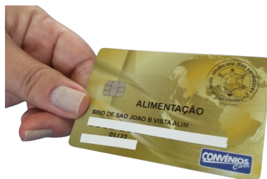
Auxílio: o suporte da Convênios Card ajudará o servidor na transação

O contato do WhatsApp da Convênios Card é (19) 9.7407-2205.