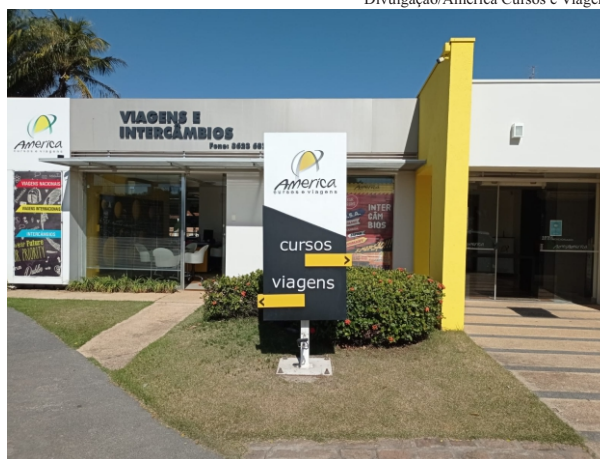
Parceira: na America Cursos e Viagens o desconto será de 30% para os sindicalizados