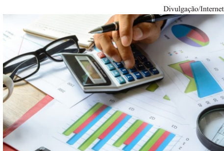
Dissídio: Sindicato dos Servidores está confiante em um final feliz

Até o fechamento desta edição ainda não tínhamos uma definição oficial, mas assim que tiver, iremos atualizar os servidores o mais rápido possível.