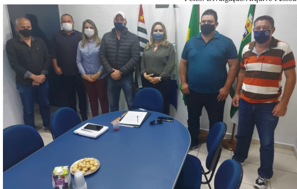
Vigias Servidores Municipais