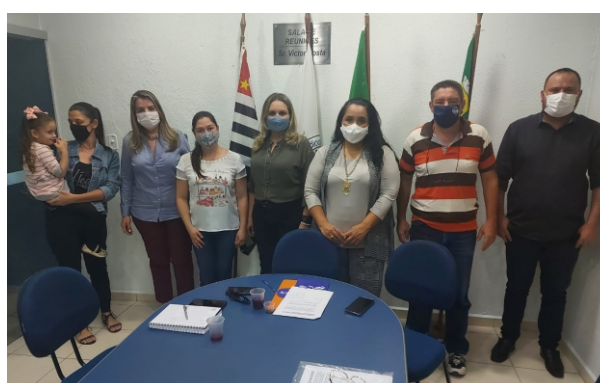
Professores de Apoio na Educação Básica