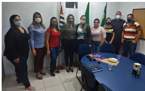
Assistentes de Desenvolvimento Infantil