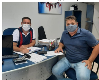
Educa: o sindicalizado terá 20% de desconto