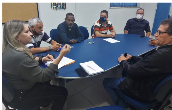
Motoristas do Departamento de Saúde