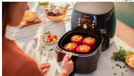
Eletrodoméstico: Air Fryer está presente nos dois kits