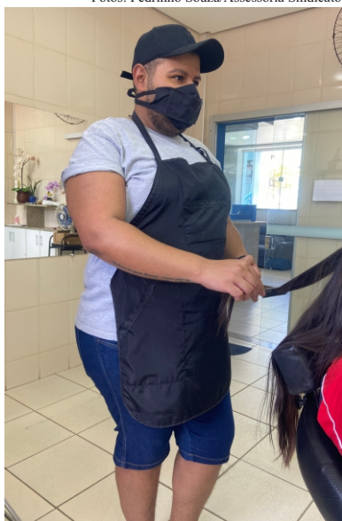
Salão de beleza: Alce é um dos novos cabeleireiros