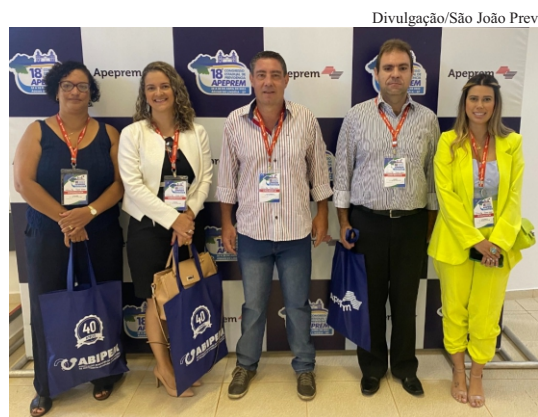
Congresso: equipe do São João Prev presente em Águas de Lindóia