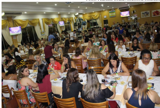
Encontro: em 2020 foi o último evento presencial de Dia da Mulher