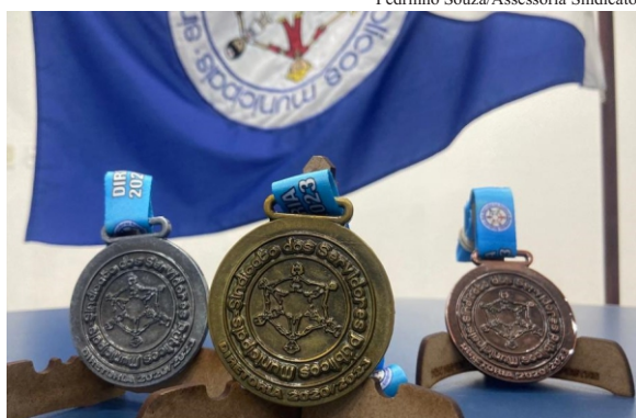
Premiação: os primeiros colocados receberão medalhas