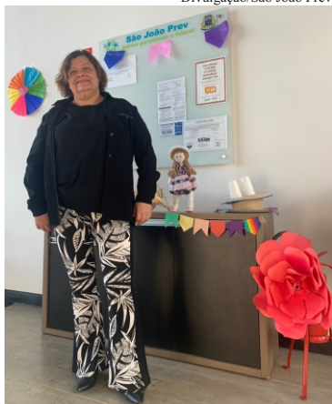
Divulgação/São João Prev

pela paciência dos responsáveis no atendimento de aposentadoria que sempre esclareceram minhas dúvidas com orientações necessárias”.