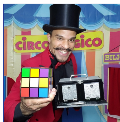
Circo Mágico Show