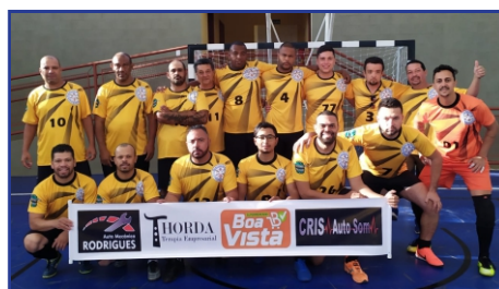
Departamento de Obras