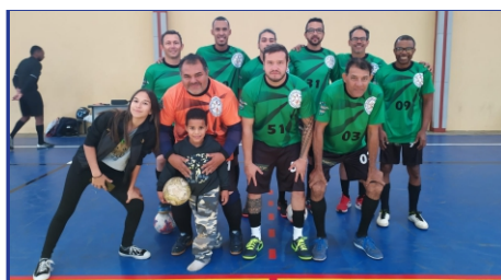
Departamento de Meio Ambiente

Vale destacar que os dois primeiros colocados