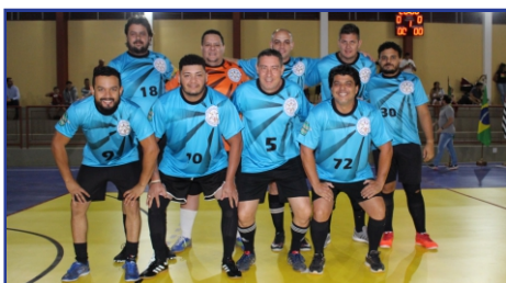
Departamento de Educação