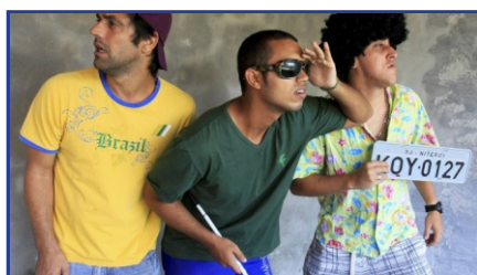
Os Três Malandros da Praça