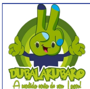
Dubalakubako (recreação de festas infantis)