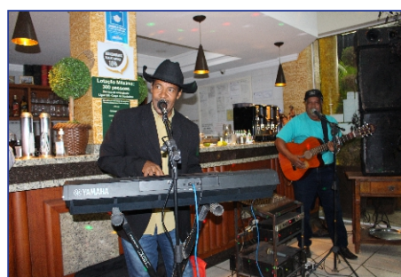
Baiano &amp; Baianinho