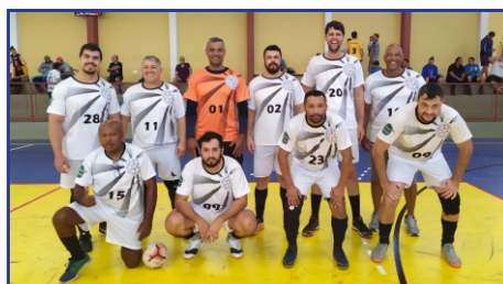
Departamento de Segurança e Trânsito