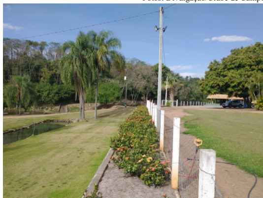
Renovação: novo cercado tem iluminação e 50 metros de floreira