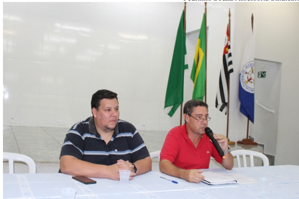
Assembleia: encontro foi realizado no salão social do Sindicato dos Servidores

Durante o encontro, os servidores presentes votaram a favor da seguinte proposta de dissídio: