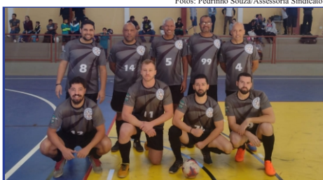
Departamento de Administração