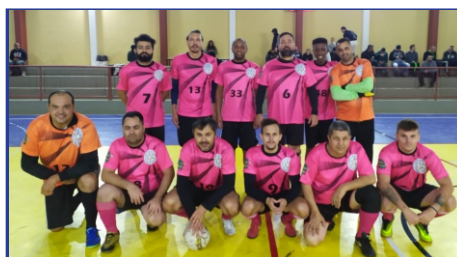
Departamento de Saúde