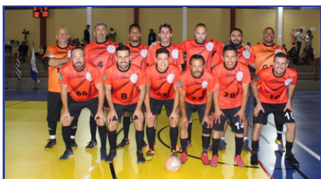
Departamento de Esportes