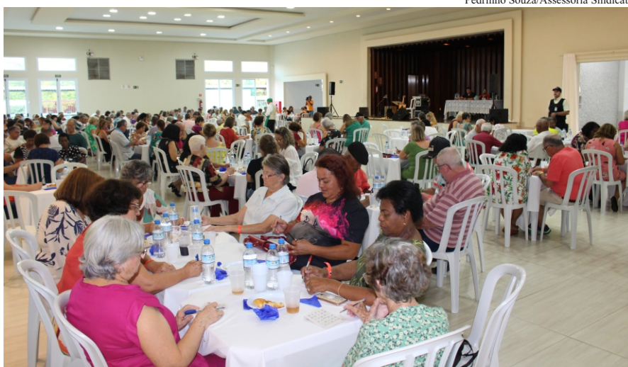
Pedrinho Souza/Assessoria Sindicato