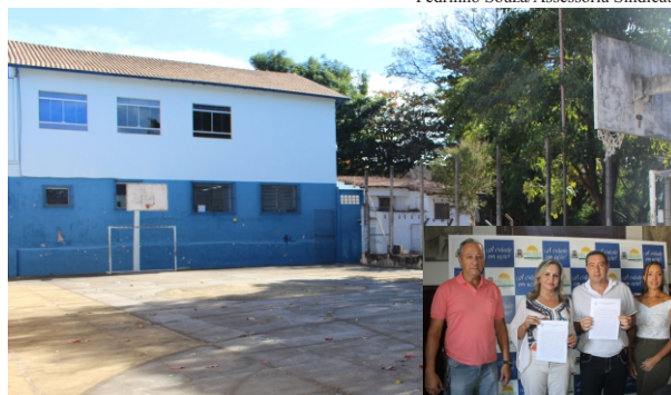
Novidade: espaço terá nova quadra, estacionamento e área de lazer