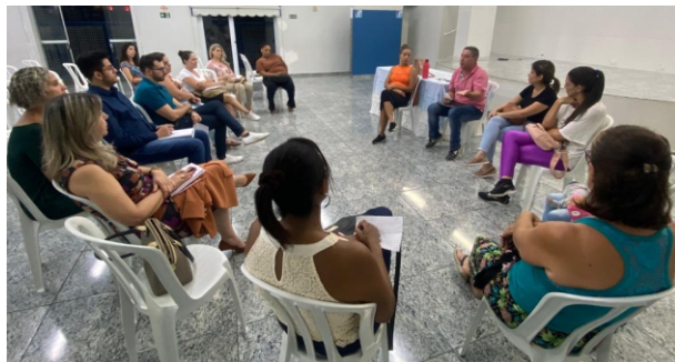
Encontro: servidores do Departamento de Educação no Sindicato

da entidade, realizado em março, para debater temas importantes em relação à categoria.