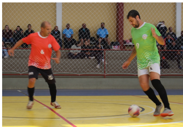
Equilíbrio: a final do Campeonato Interno foi decidida nos detalhes

Cada setor terá um atleta que está responsável pela equipe. A previsão para o início da competição é em agosto.