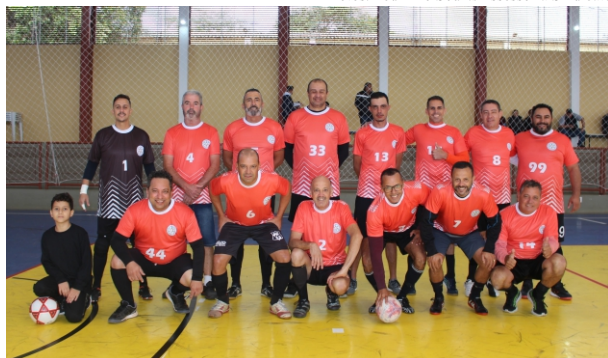
Campeão: Departamento de Esportes cresce na reta final e levanta a taça