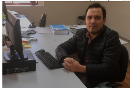
Mayson: Concurso de Monografias é idealizado pelo TCE-SP