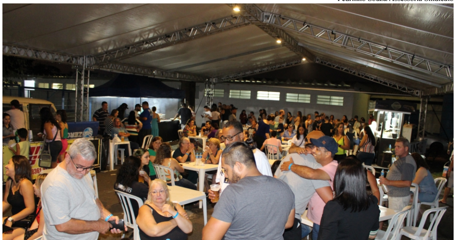
Em 2022, o Dia do Servidor Público foi comemorado no complexo do CIC, em três ambientes