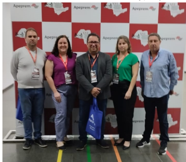
Encontro Jurídico e Financeiro: um dos principais no segmento de RPPS