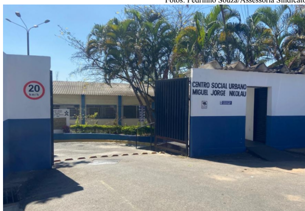
Entrada: este ano o evento será realizado no interior do CSU/DER