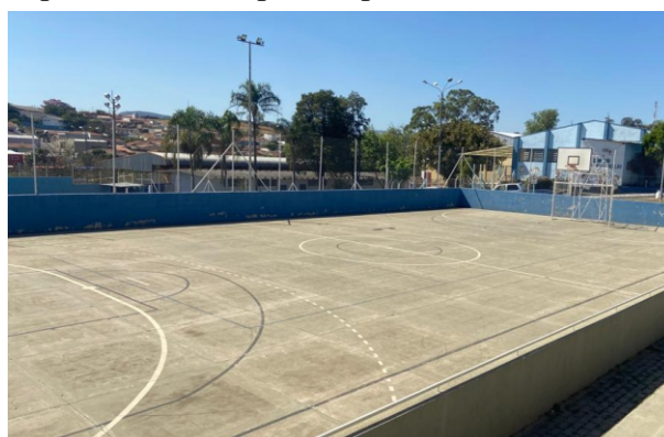
Cobertura: no Dia do Servidor o local será coberto com uma tenda

Como foi feito em 2022, a retirada das pulseiras será na secretaria do Sindicato dos Servidores, de 2 a 27 de outubro. Cada associado deve retirar a sua própria pulseira e dos seus dependentes. Não perca o prazo.