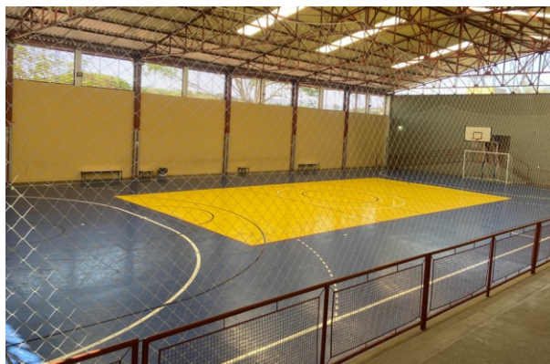
Brinquedos: espaço ficou reservado para crianças e adolescentes

A quadra 1 do CSU/DER (foto ao lado) será totalmente coberta com tenda. E o espaço está reservado para os shows e a praça de alimentação, que este ano estará mais diversificada.