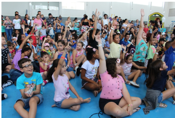
Crianças: dois espaços kids estarão reservados no Dia do Servidor