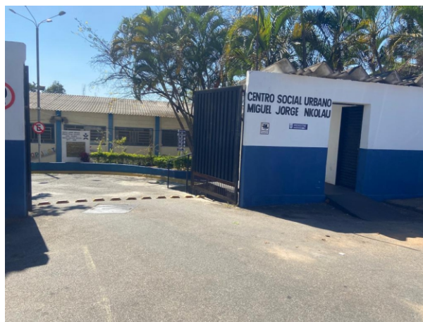
Entrada: evento será realizado nas dependências do CSU/DER