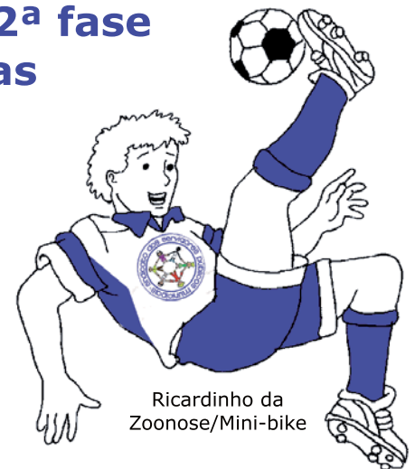
Ricardinho da Zoonose/Mini-bike

O time do Sindicato já iniciou sua participação na 2ª fase da Copa, que começou no último dia 27. Porém, como este jornal foi fechado antes desta data não foi possível divulgar os resultados.