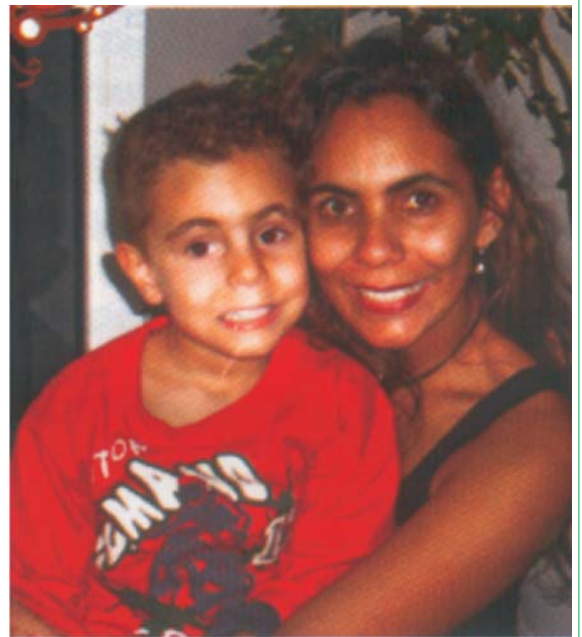
Kamila Departamento de Educação

As fotos ao lado é uma forma do Sindicato prestar sua homenagem a todas as mães pelo seu dia. Parabéns a todas as mães!