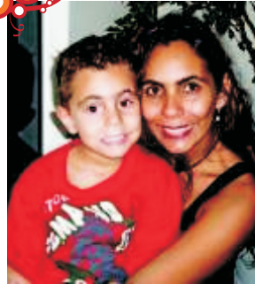
Kamila Depto de Educação