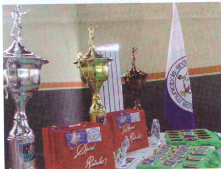
Troféus, medalhas e brindes

foram sorteados brindes entre os servidores que participaram de todos os jogos de sua equipe. A mais participativa do campeonato foi a do Departamento de Saúde.