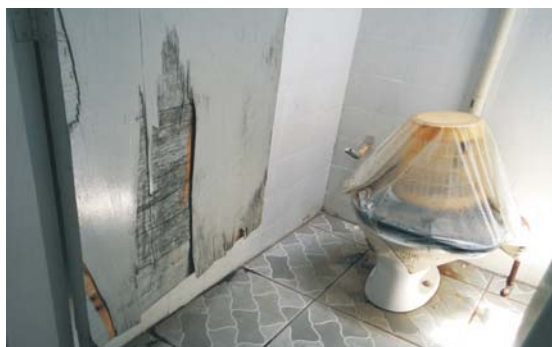
Portas quebradas e vaso intertitado: imagem do descuido

Uma visita ao pátio revelou situações assustadoras. São cerca de 300 funcionários que