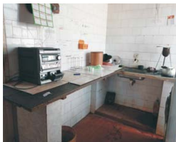
Abaixo, a cozinha antiga.

com rombos enormes. E outro com quatro vasos, no entanto, com piso de cimento, que não favorece a limpeza, além de propiciar o acúmulo de bactérias, e com janela sem vidros. Se não bastassem os sanitários sem condições dignas de uso, o bebedouro é outro problema. Em pleno verão, com temperaturas sufocantes, os funcionários não têm água gelada para beber. O argumento é que uma peça do filtro está quebrada... mas já passam de dois meses sem providências, denunciam os funcionários. Será que a tal peça vem de barco a remo da China?