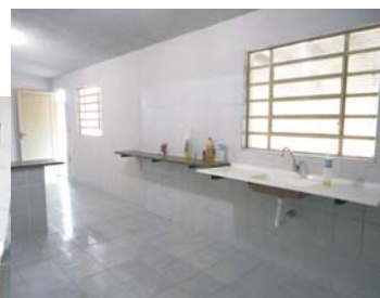
Acima, a nova cozinha. Espaço, organização e facilidade de limpeza.