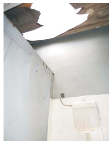
Telhas quebradas: teto solar indesejado

Para outro colaborador, com mais de 30 anos de serviço no local, “os banheiros são uma vergonha, não tem condições.” São dois banheiros masculinos, um com três vasos, portas quebradas, telhas