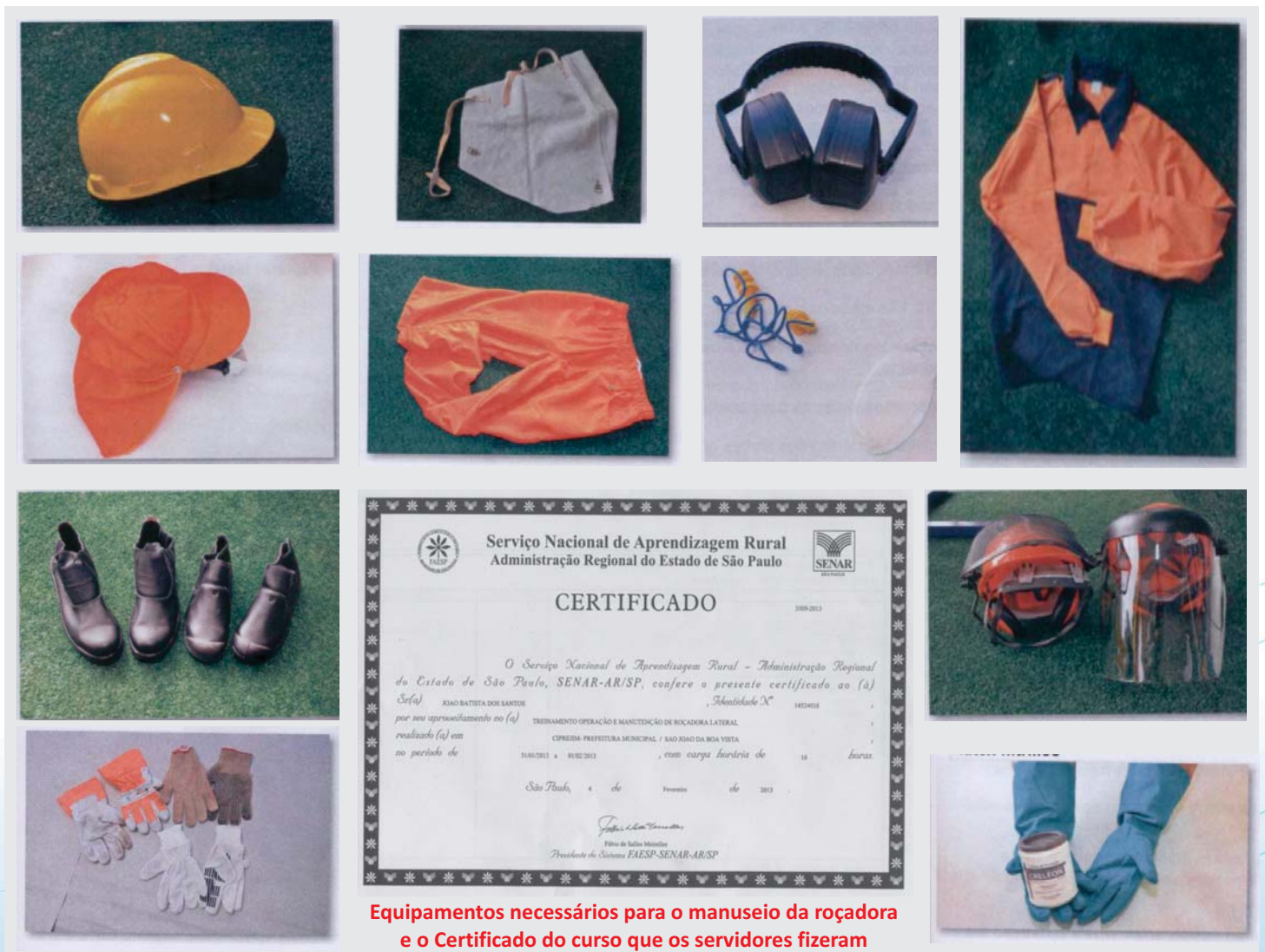
Equipamentos necessários para o manuseio da roçadora e o Certificado do curso que os servidores fizeram

Diante desta situação, a diretoria do Sindicato realizou um boletim de ocorrência sobre o caso e vai auxiliar