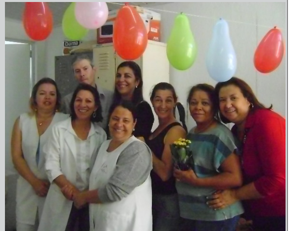
AMIGAS(OS) DA UNIDADE DE SAÚDE DR. DELVO WESTIN

Vai ser ruim a sua ausência, vai ser triste sem você aqui para alegrar nossos dias. Quando alguém que a gente gosta e admira vai embora é como se um pedaço nosso fosse junto também, pois você é muito especial para todos nós. Estamos torcendo para que seus dias sejam de muito prazer e realizações, que sua nova jornada lhe traga muito sucesso e alegria, que você conquiste novos amigos, mas nunca se esqueça dos que aqui ficaram, que embora distantes, torcem para que sua vida siga adiante com determinação, alegria e muita felicidade. Leve em seu coração essa mensagem que traduz um pouco do que sentimos e o muito que você significa para todos que ficaram. Seja muito Feliz.