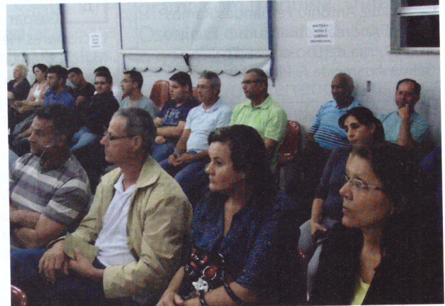
Servidores puderam escolher entre duas propostas de aumento na assembleia