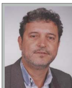
Magrão PP 11.024