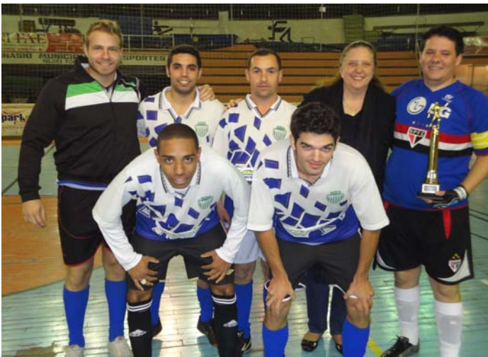
Acima, equipe da Educação, campeã do 1º turno