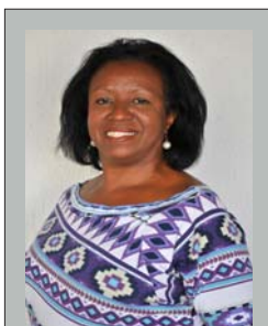
Áurea PT 13.333