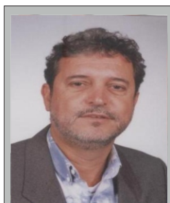
Magrão PP 11.024