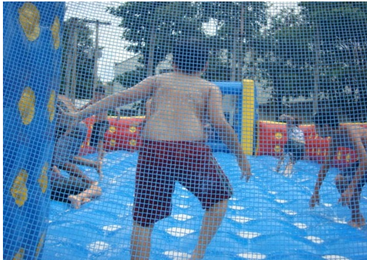
Festa do Dia das Crianças, em 2011, organizada pelo Sindicato

Para comemorar a melhor fase da vida — e que passa tão depressa — o Sindicato está investindo mais um ano em um dia de festa e muita diversão para a turminha com até 12 anos, filhos de servidores sindicalizados. O evento se realizará dia 12 de Outubro, no Clube Mantiqueira, que conta com amplo espaço, muito verde, possui fácil acesso e estacionamento no local.