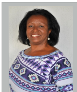
Áurea PT 13.333