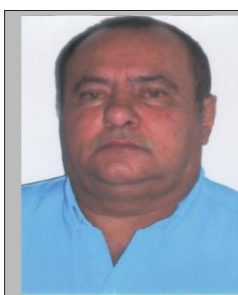
Turco da Ambulância PSB 40.222