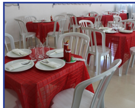
Sindicato: oferece 40 jogos de mesas no salão

Em dezembro de 2023, foi feita uma reforma no salão