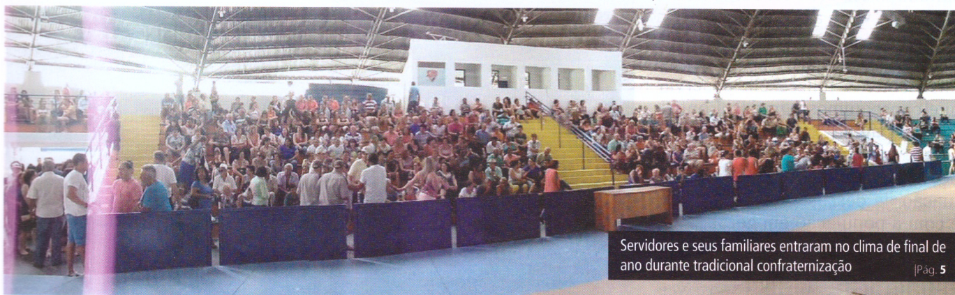
Servidores e seus familiares entraram no clima de final de ano durante tradicional confraternização