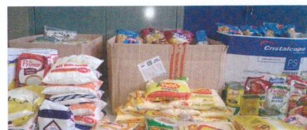
Alimentos doados pelos servidores foram entregues ao SAE