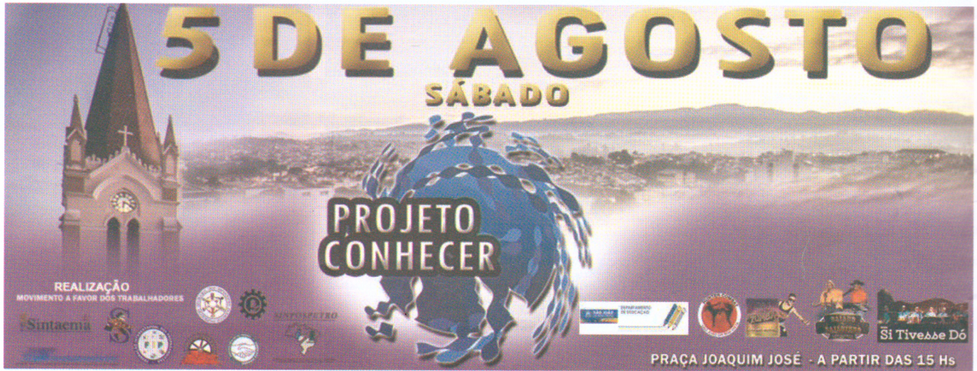
CHARGE | Vamos promover a inclusão