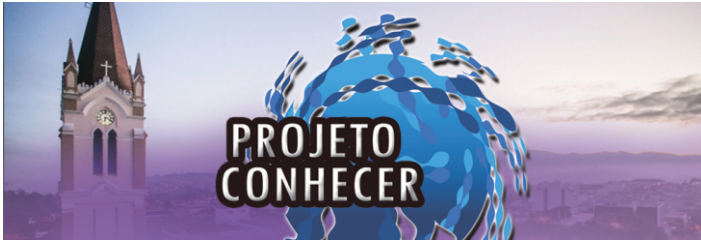
( logo do Projeto Conhecer )