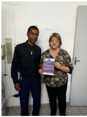
Homenagem a Dpt. Educação - Dança