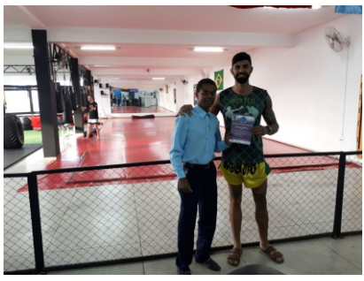
Homenagem a Hunter Combat - Muay Thai