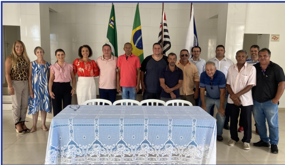
Diretoria: membros da Chapa Azul, que venceu a eleição do Sindicato dos Servidores