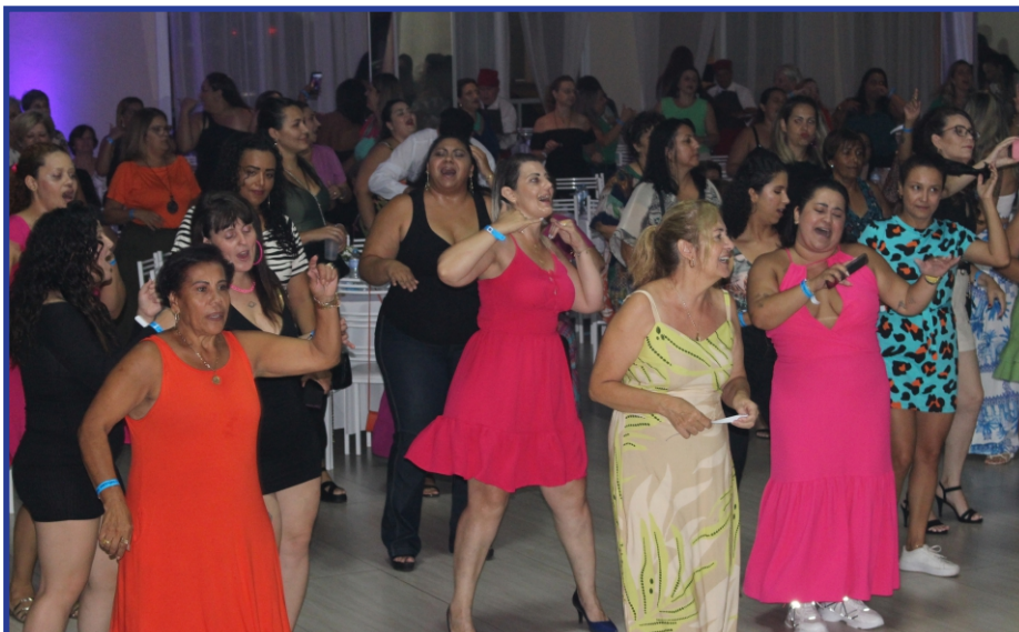
Alegria: em 2023 o evento contou com a presença de mais de 700 servidoras associadas