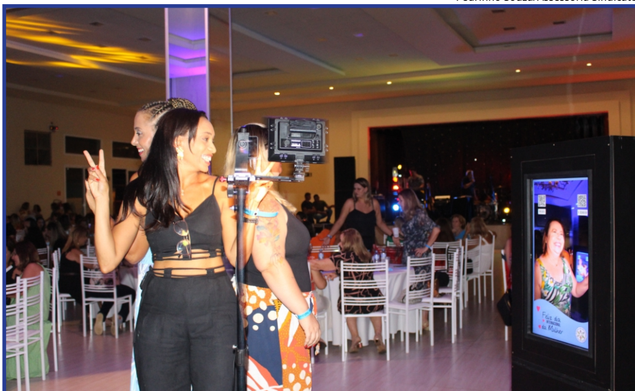
Click: em 2023, a plataforma de fotos em 360º fez sucesso entre as servidoras associadas