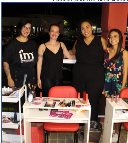
Maquiagem: o IM esteve presente no Dia da Mulher

moderno em termos de ensino e experiências pedagógicas.