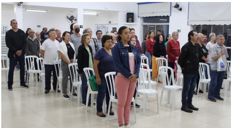
Reajuste: nos últimos três anos, a diretoria do sindicato atingiu uma recuperação salarial de 28%