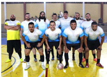
Vice-campeão: Departamento de Educação