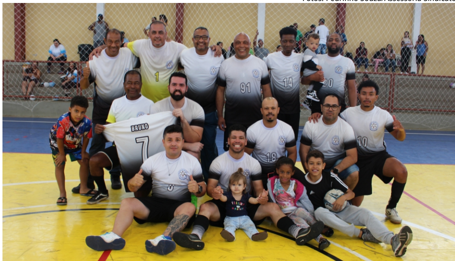
É campeão: pelo segundo ano consecutivo, Departamento de Obras fica com o título