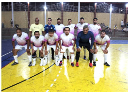
Terceiro lugar: Engenharia/Setran