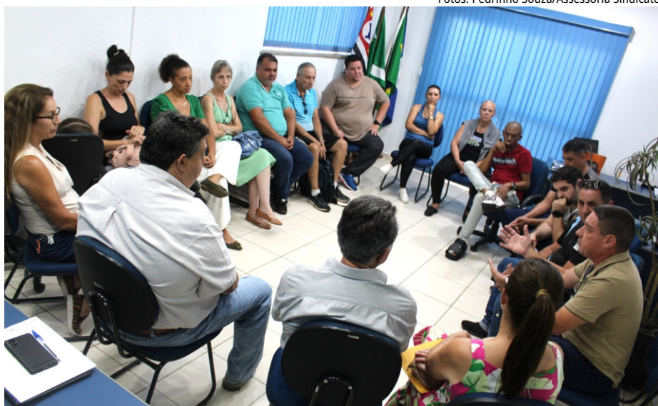
Reunião positiva: diretoria do Sindicato dos Servidores discute principais assuntos da categoria