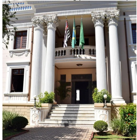
Prefeitura: cálculo dos retroativos está sendo realizado

ocorre após a sanção da Lei Complementar nº 226/26, conhecida como Lei do Descongela, que autoriza a recomposição desses direitos aos servidores públicos.