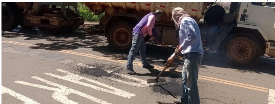
Insalubridade: servidores do Departamento de Obras realizam manutenção no asfalto