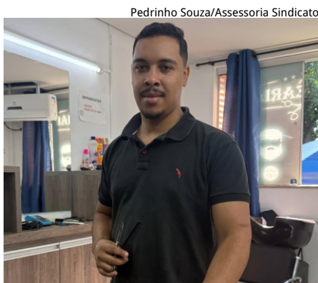
Pedrinho Souza/Assessoria Sindicato

Agendamento: diretamente com o profissional