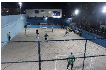
Esporte: Reio Futsal participou do jogo festivo

Para marcar a inauguração da quadra, foi realizado um jogo festivo entre a equipe do Reio Futsal e um time formado por associados ao sindicato.