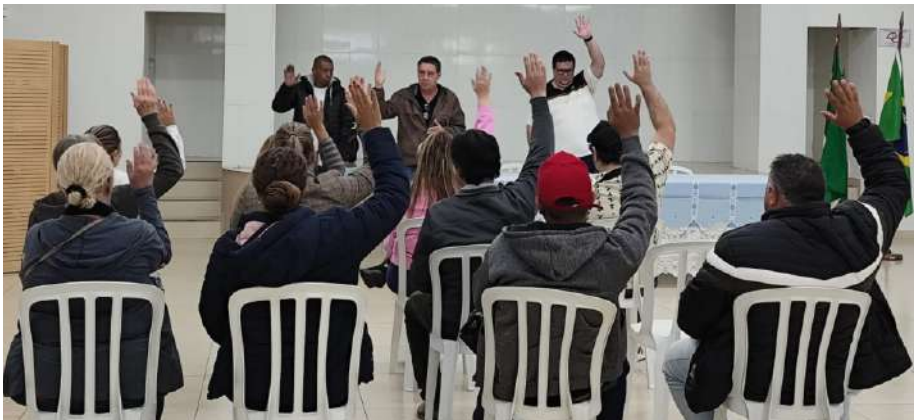
Novidade: entre os principais pontos da atualização está a reorganização da estrutura administrativa

A medida tem como objetivo estimular a renovação das lideranças e promover a alternância na condução da entidade.