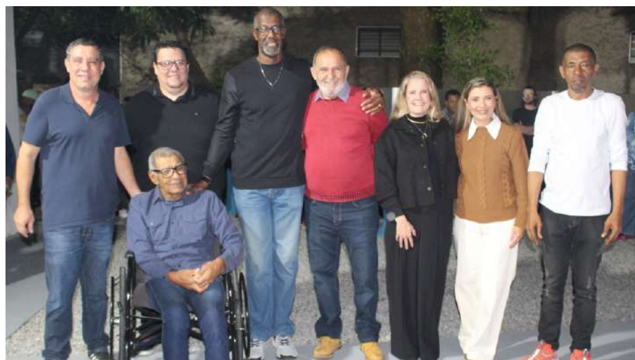
Inauguração: autoridades e homenageados participaram da solenidade de inauguração do novo espaço