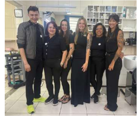
Equipe do salão de beleza