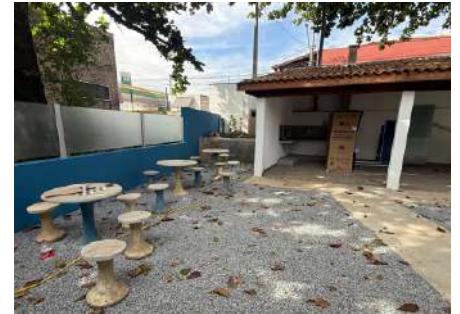
Espaço de lazer